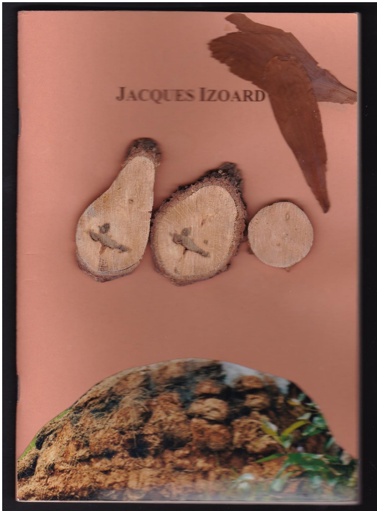
jacques izoard édition de 2006 signée et numérotée couverture originale de Françoise Favretto collage photographie, coupes de bois, pétales de magnolia 70 euros LIVRE UNIQUE